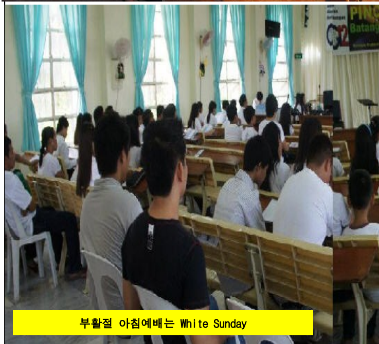
부활절 아침예배는 White Sunday