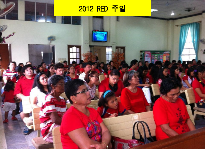
2012 RED 주일

알라룸푸르는 좀 더 자유롭게 복음을 전할 수 있어서 감사를 전해 왔습니다.