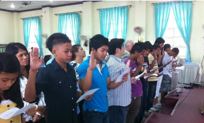
2012 청소년들 순결 서약식 “주님 저의 몸과 마음은 제 것이 아니오니”