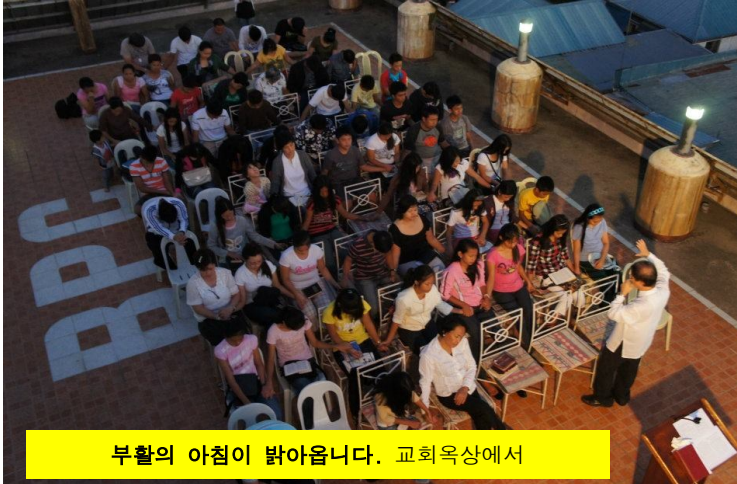
부활의 아침이 밝아옵니다. 교회옥상에서