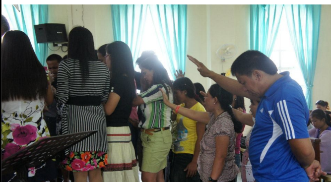
파송 선교사들을 위하여 전 교인들은 기도함

교인들의 기쁨이 교회의 기쁨이며 주님의 기쁨이라고 믿습니다. 오래 전부터 창립 예배의 초점을 준비하면서 기도할 때 결혼은 하였으나 아직 결혼식을 못 올린 젊은 교인들을 기억나게 하셨습니다. 그래서 교인들을 조