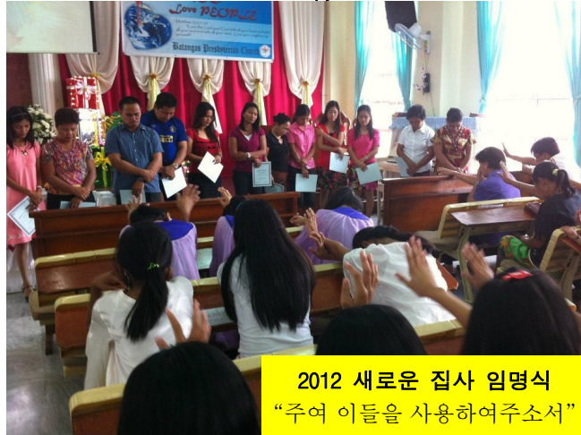
2012 새로운 집사 임명식 “주여 이들을 사용하여주소서”

께 함께 하시길 기도합니다. 올해도 매년과 동일하게 원단금식으로 3일을 주님께 올려 드렸습니다. 하나님께 올해에 향하신 놀라운 계획들을 기대하고 기도하였는데 신실하신 하나님께서는 놀랍게 하루하루를 깜짝 놀라게 해 주셨습니다. 이는 모두 하나님의 은혜와 배후에서 끊임없이 기도하시는 여러분들의 사랑의 열매라고 믿어 의심치 않습니다.