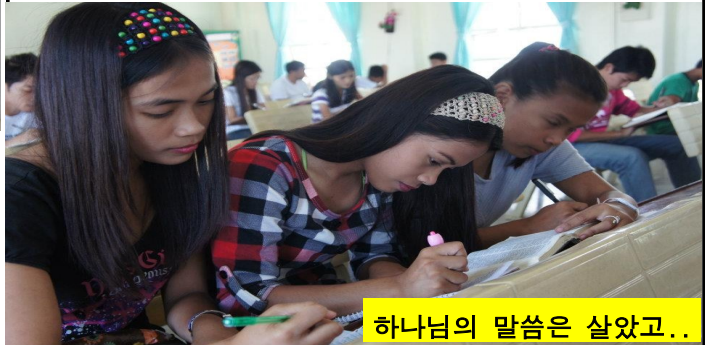
하나님의 말씀은 살았고..

그리고 금요일 오전에는 교인 7명을 선정하여 주님의 가상철언재현하고 간증을 하도록 하였습니다. 2000년 전에 십자가에서 돌아가신 주님이 나와 어떤 관계이며 오늘도 어떻게 역사하시는가에 대하여 나누는 시간이었습니다.