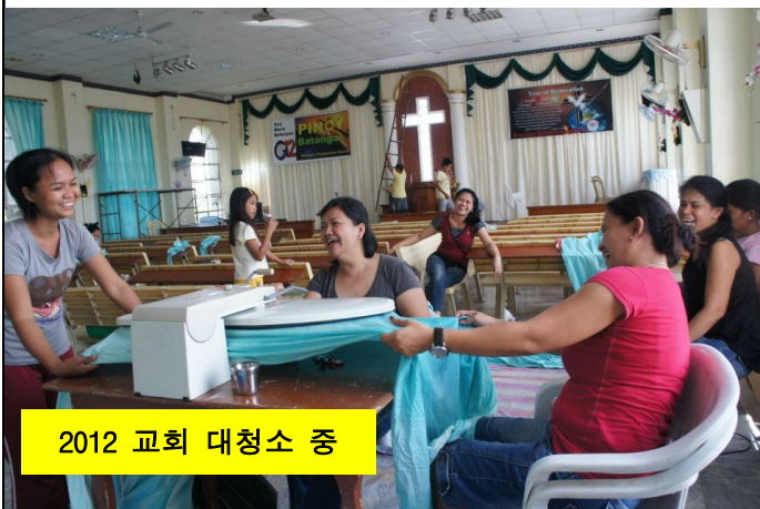
2012 교회 대청소 중

그리고 금요일 오전에는 교인 7명을 선정하여 주님의 가상철언재현하고 간증을 하도록 하였습니다. 2000년 전에 십자가에서 돌아가신 주님이 나와 어떤 관계이며 오늘도 어떻게 역사하시는가에 대하여 나누는 시간이었습니다.