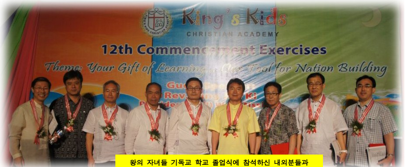
왕의 자녀들 기독교 학교 졸업식에 참석하신 내외분들과

이곳 필리핀에서 교육 선교 사역은 정말 내일을 살리는 사역입니다. 이 나라를 살리는 사역이라고 감히 말하고 싶습니다. 이를 위하여 여러분의 관심과 기도가 절실 히 필요합니다.