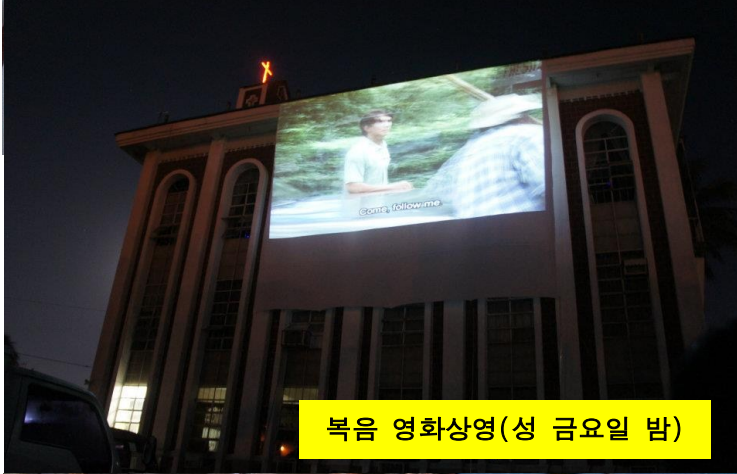
복음 영화상영(성 금요일 밤)