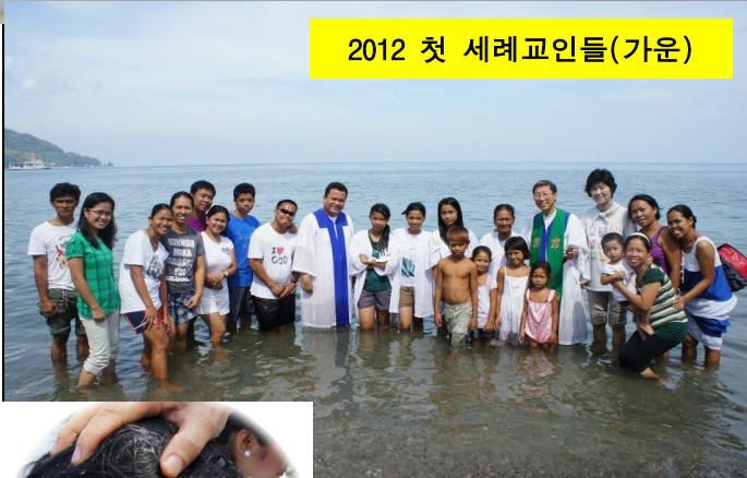
2012 첫 세례교인들(가운)