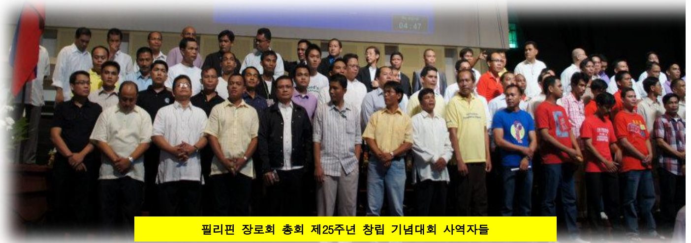
필리핀 장로회 총회 제25주년 창립 기념대회 사역자들