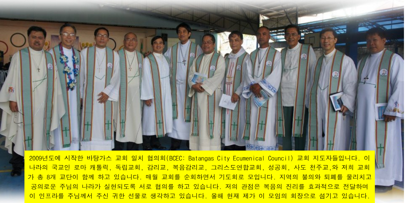
2009년도에 시작한 바탕가스 교회 일치 협의회(BCEC: Batangas City Ecumenical Council) 교회 지도자들입니다. 이 나라의 국교인 로마 개톨릭, 독립교회, 감리교, 복음감리교, 그리스도연합교회, 성공회, 사도 천주교,와 저희 교회가 총 8개 교단이 함께 하고 있습니다. 매월 교회를 순회하면서 기도회로 모입니다. 지역의 불의와 퇴폐를 물리치고 공의로운 주님의 나라가 실현되도록 서로 협의를 하고 있습니다. 저의 관점은 복음의 진리를 효과적으로 전달하며 이 인프라를 주님께서 주신 귀한 선물로 생각하고 있습니다. 올해 현재 제가 이 모임의 회장으로 섬기고 있습니다.