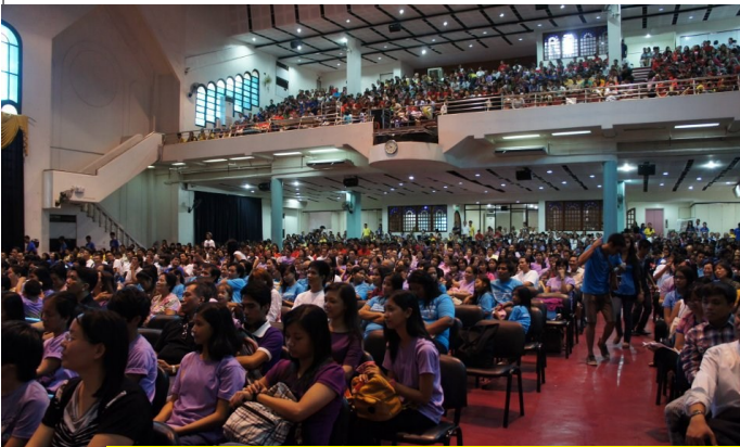
필리핀 장로회 총회 제25주년 창립 기념대회