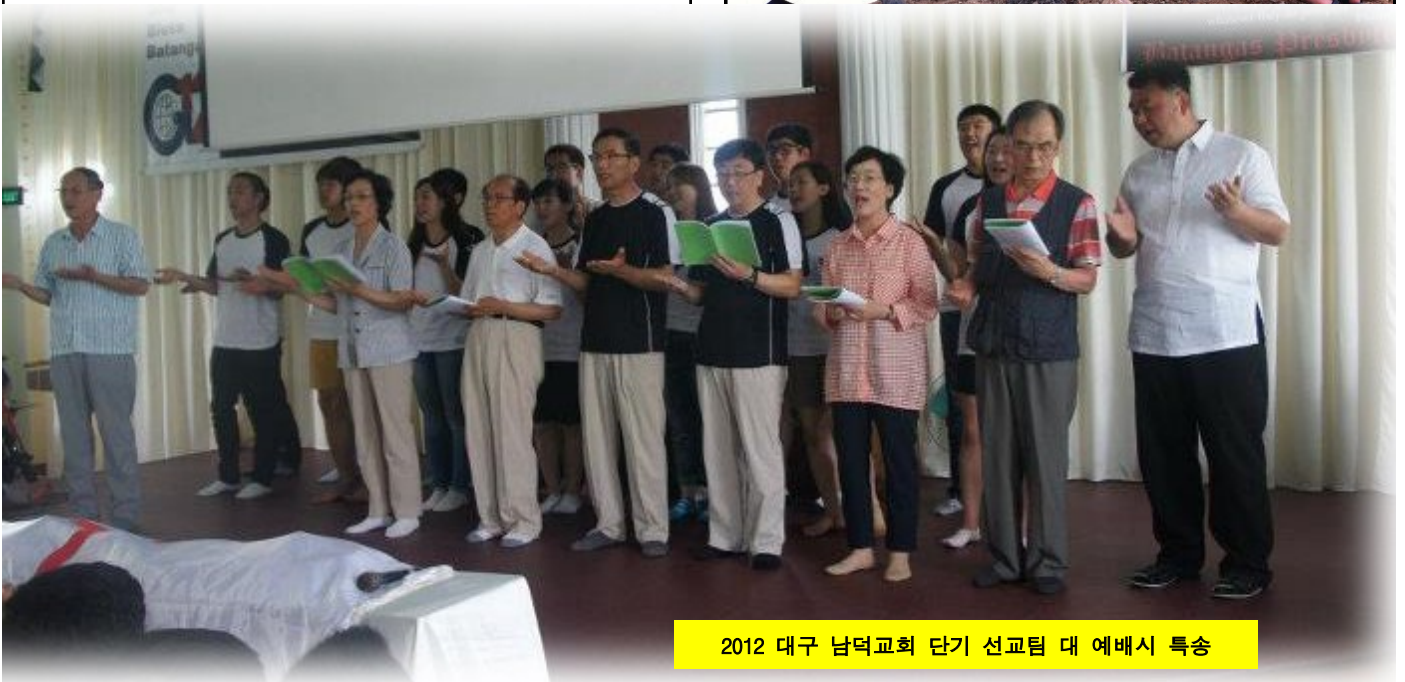
2012 대구 남덕교회 단기 선교팀 대 예배시 특송