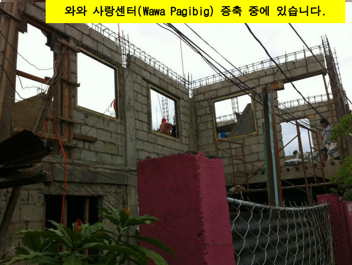
2012년도 단기 선교 팀 소식