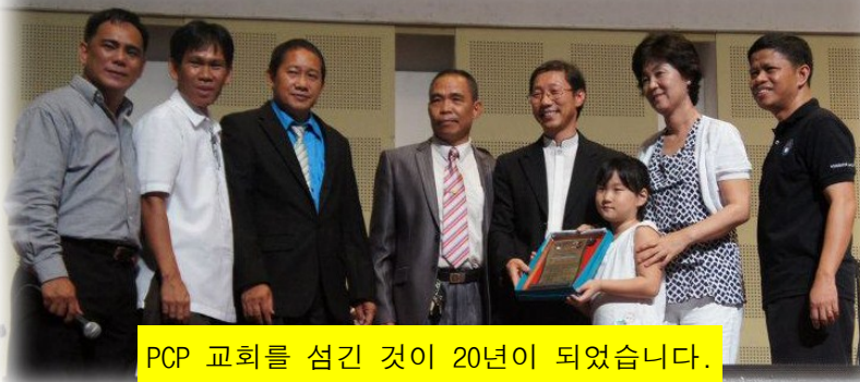
PCP 교회를 섬긴 것이 20년이 되었습니다.

니다.” 또한 그 동안 총회를 지속적으로 섬 겨왔던 사역자들 가운 데 10년 차, 20년 차 의 근속상도 주어졌습 니다. 감사하게도 저 희 가정 또한 20년을 본 교단을 섬겼기에 주님께 감사를 드렸습 니다. 배후에는 많은 분들의 기도와 사랑이