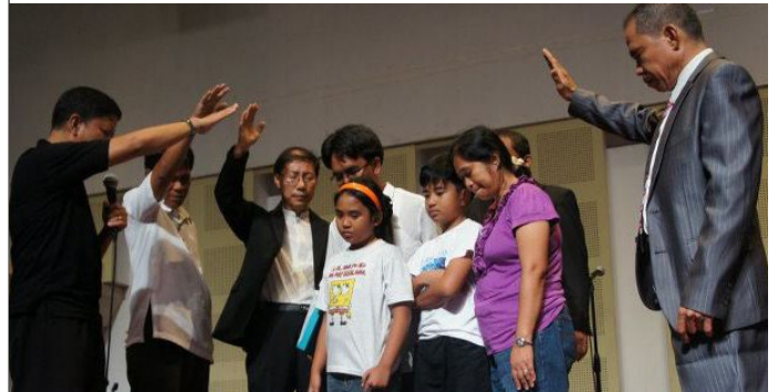
총회 임원들과 대회 참석자 모두 선교사를 위하여 기도