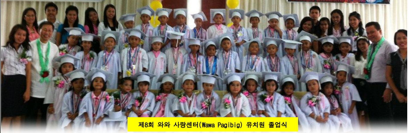
제8회 와와 사랑센터(Wawa Pagibig) 유치원 졸업식