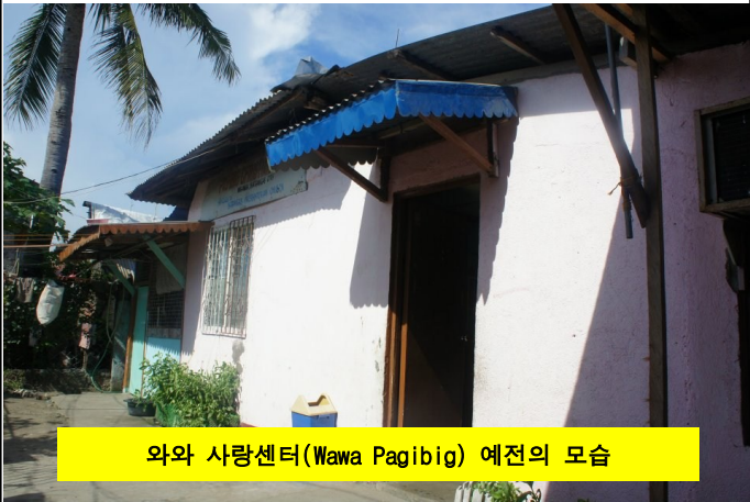
와와 사랑센터(Wawa Pagibig) 예전의 모습

조그만한 집을 한 채 구입하여 교실로 개조하여 사용하고 있다가, 옆으로 확장하였어도 늘 장소가 협소하고 비가 오면 지붕에서 빗물이 떨어지고 어려운 환경이었습니다. 오랫동안 증축을 위하여 기도를 하고 있었습니다.