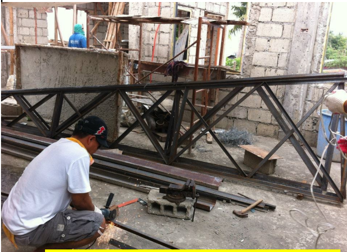
와와 사랑센터(Wawa Pagibig) 증축 중에 있습니다.

공사가 진행되는 동안 악한 세력이 틈타지 않도록 기도를 부탁 드립니다. 사실 이 지역은 필리핀의 이단이 강한 지역입니다.