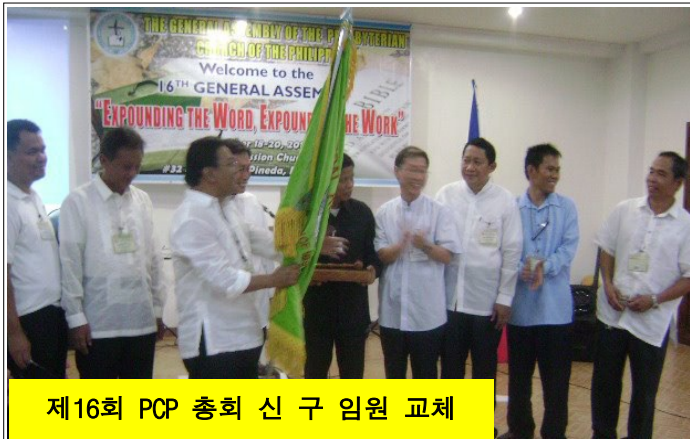
제16회 PCP 총회 신 구 임원 교체

작년 제16회 필리핀 장로교회 총회(GAPCP)에서 부족한 제가 부총회장으로 선출되었습니다. 특별히 지난 부총회장의 선출 후보가 필리핀 현지인 목회자후보와 선교사인 제가 함께 경선이 되었습니다. (이런 일은 예전에도 없었고 앞으로도 없을 겁니다.) 그래서 저의 정견발표는 필리핀교단에 필리핀의 지도자가 세워져야 한다고 강조하였지만 총회에 참석한 총대들의 개표결과와는 부족한 것에 많은 표를 던져주었습니다. 결국 겸허히 하나님의 뜻으로 받아 들였습니다. 그래서 오는 10월 중순에 저희 바탕가스 장로교회에서 제17회 성총회를 유치하게 되었습니다.